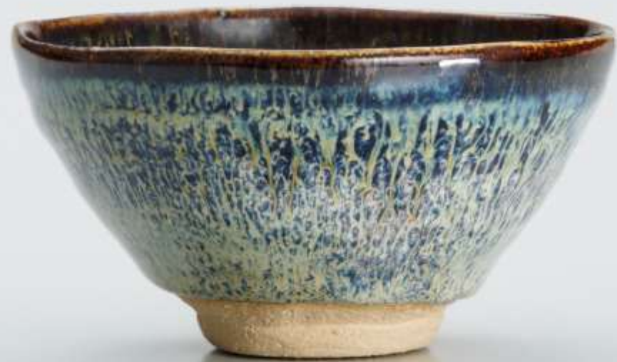
10 天目宙茶盃 Tenmoku Sora Tea Bowl

2009年 h:6.9cm d:13.2cm wt:281g 匿名氏寄贈 Anonymous gift