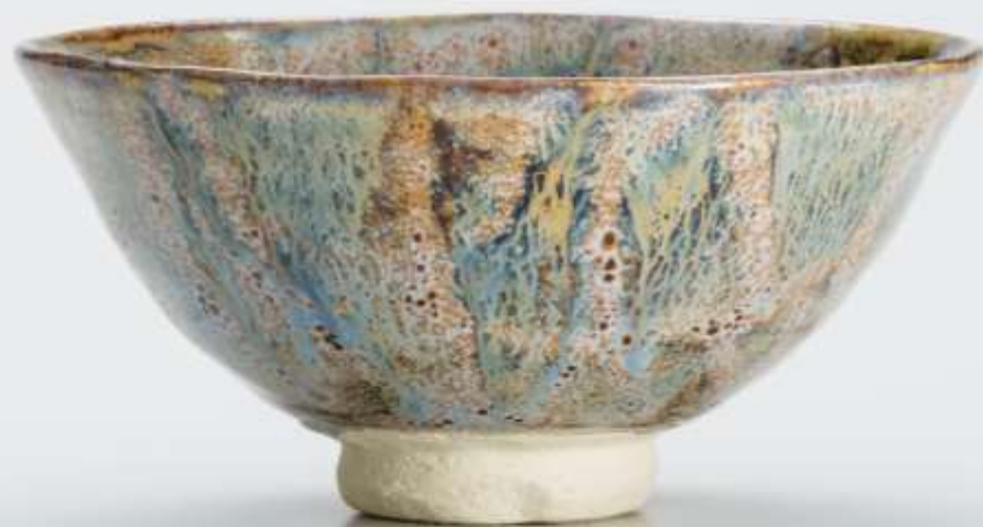
12 禾目極星茶盃 Nogime Kyokusei Tea Bowl

2013年 h:7.4cm d:14.8cm wt:315g 匿名氏寄贈 Anonymous gift