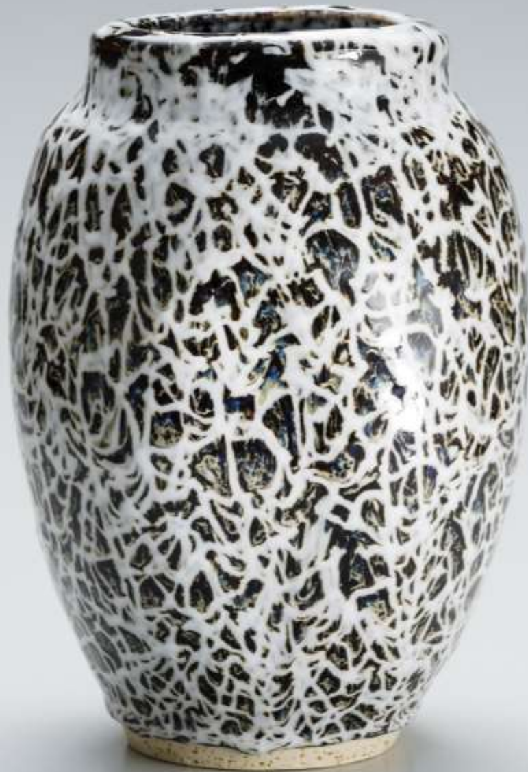
21 天空壺 Tenku Jar

2009年 h:25.8cm d:18.0cm wt:2,580g 匿名氏寄贈 Anonymous gift