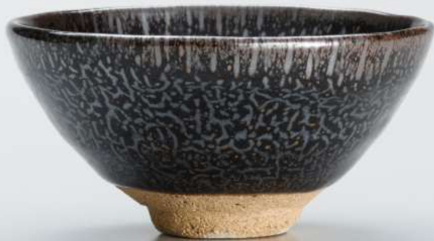
4 松樹天目茶盃 Shoju Tenmoku Tea Bowl

2005年 h:6.5cm d:13.5cm wt:285g 匿名氏寄贈 Anonymous gift