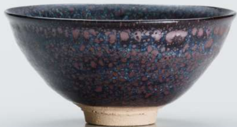
1 油滴天目茶盃 Yuteki Tenmoku Tea Bowl

1996年 h:6.3cm d:13.3cm wt:274g 匿名氏寄贈 Anonymous gift