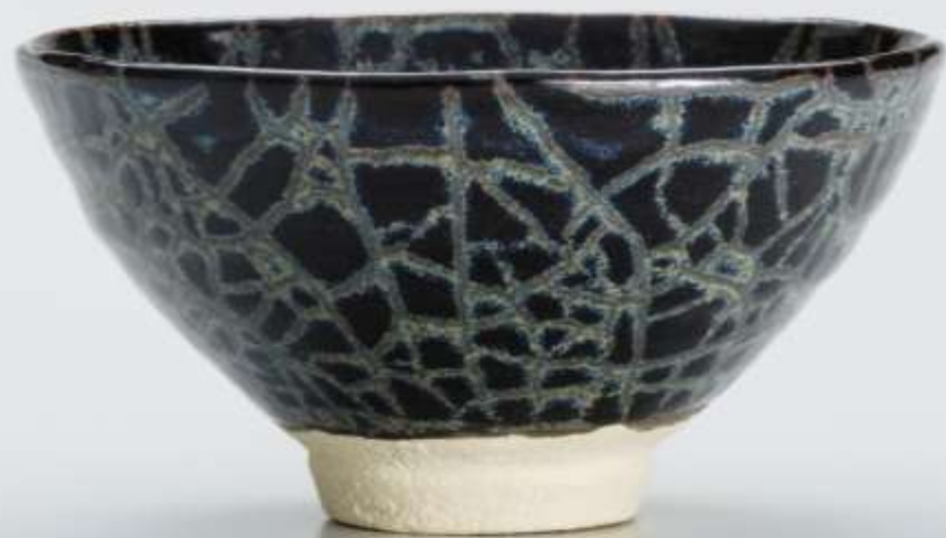
14 天都茶盃 Tento Tea Bowl

2017年 h:7.3cm d:13.6cm wt:248g 匿名氏寄贈 Anonymous gift