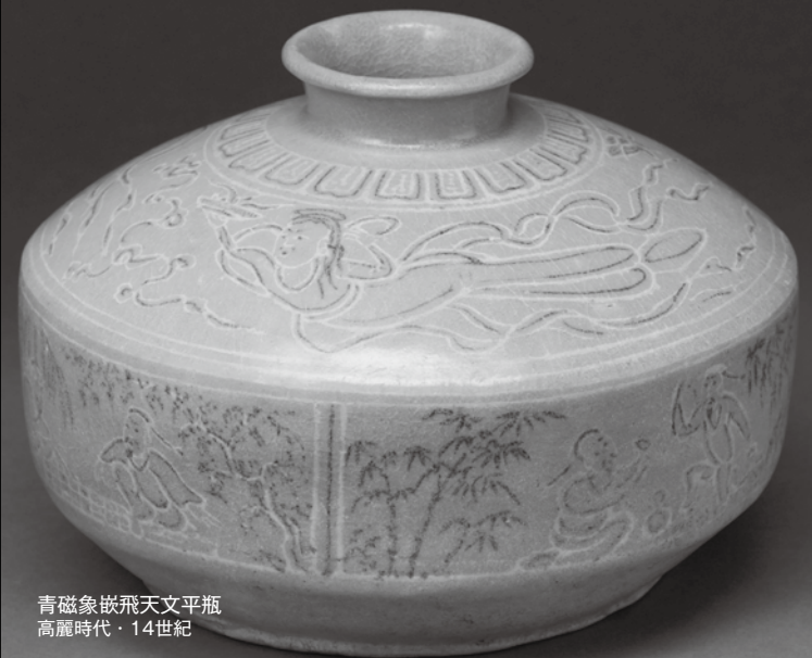
青磁象嵌飛天平瓶 高麗時代・14世紀